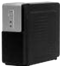
ИБП Back Office